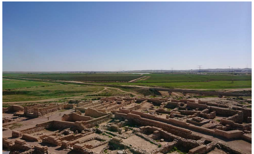
Ben-Gurion University of the Negev | Be'er Sheva, Israel