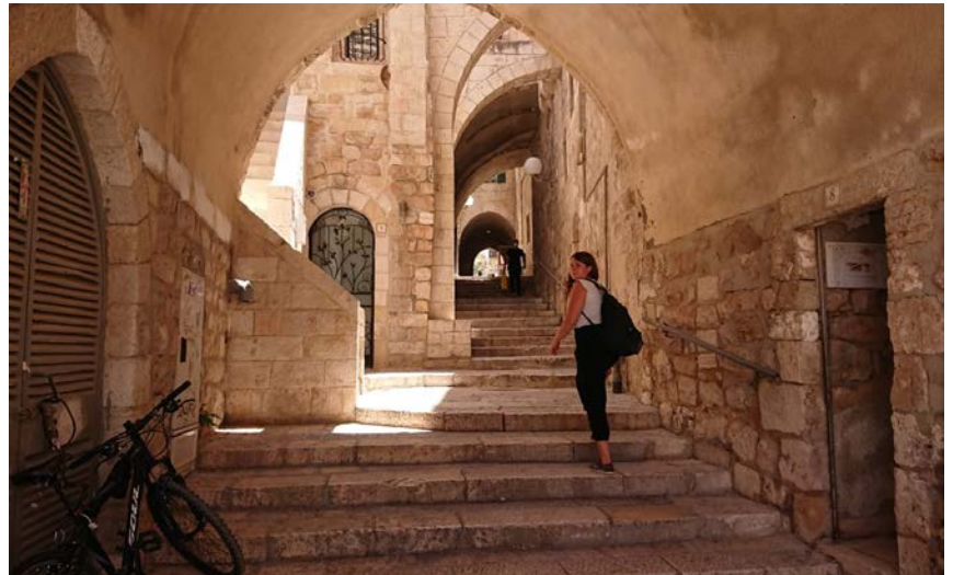
Ben-Gurion University of the Negev | Be'er Sheva, Israel